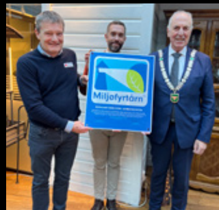
Rogaland Røde Kors var først ute til å bli sertifisert som Miljøfyrtårn.