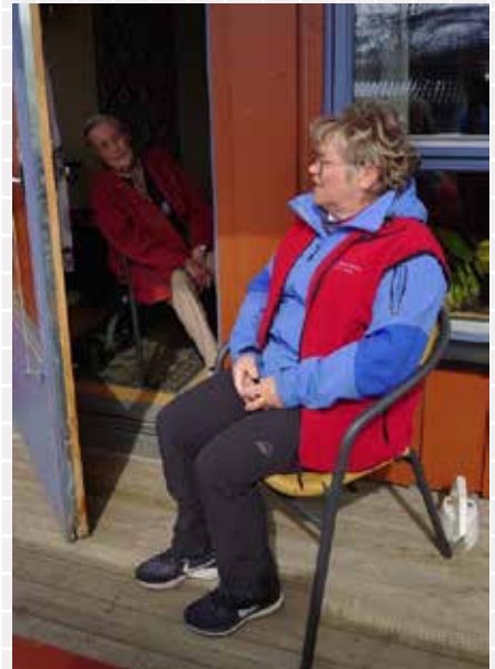
Tekst og foto: Øyvind Mikal Rebnord-Johnsen

For Gudrun er oppdraget og budskapet tydelig. Ingen skal sitte alene i isolasjon og