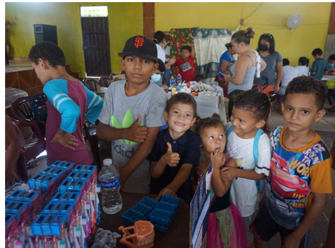
Barna i nabolaget står tålmodig i kø for å få tannbørster og tannsjekk. Den mobile helseklinikken kommer en gang i måneden og tilbyr kjærkommen hjelp til familiene.