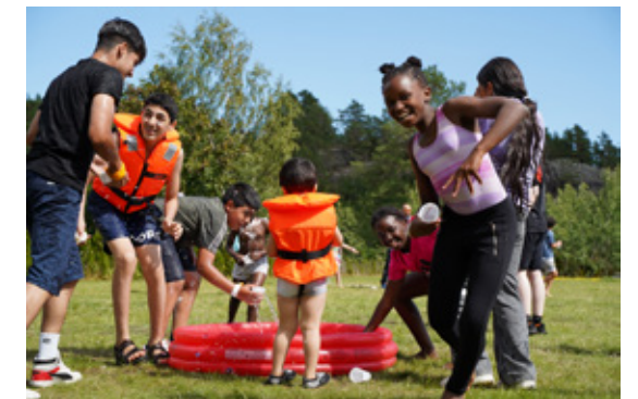
I Kragerø stod blant annet båtturer og vannkrig på programmet.