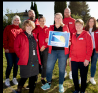
Fornøyde ansatte i Telemark Røde Kors med Miljøfyrtårn-diplomet.