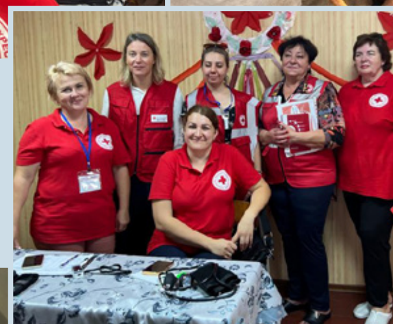
Heltene i den humanitære innsatsen er frivillige og ansatte i ukrainske Røde Kors. Mange av dem er selv internt fordrevne flyktninger.