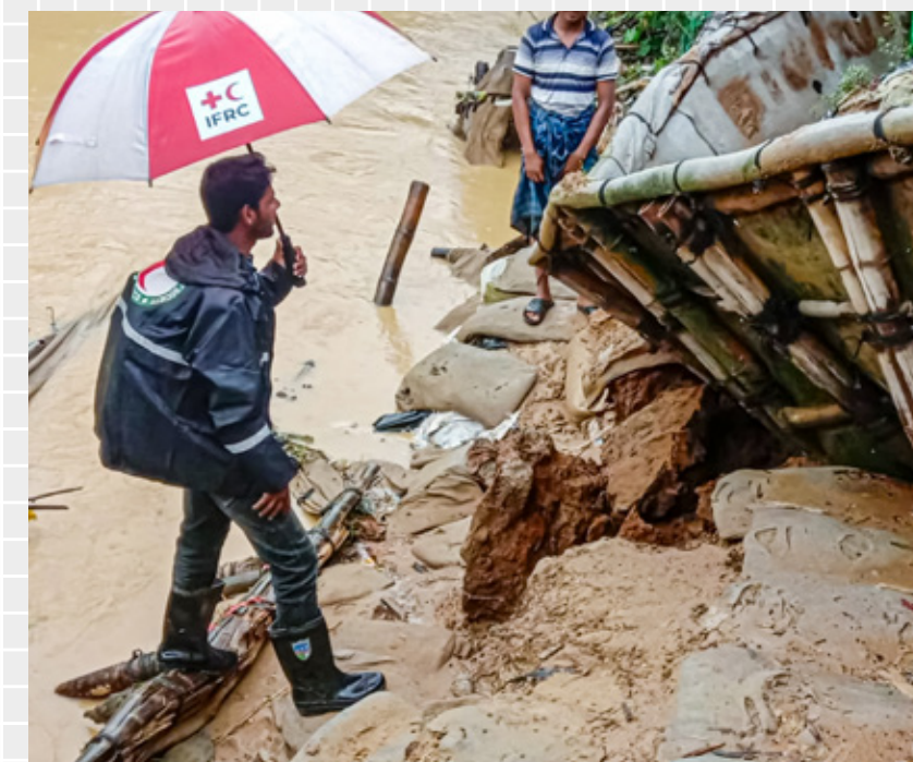
Landsbyen Alimura i Ukhiya i Cox's Bazar, Bangladesh. Denne kanalen går forbi landsbyen Alimura og flommet over under monsunen. Flommen forårsaket store skader på avlinger og husholdninger de siste årene.