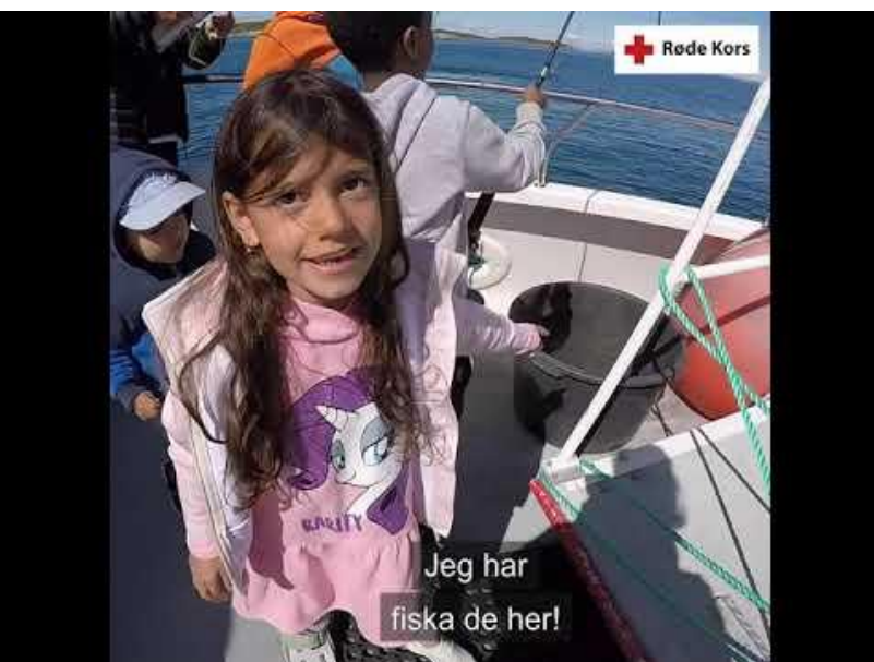
Ferieminner fra fisketur på Steigen. Film: Røde Kors