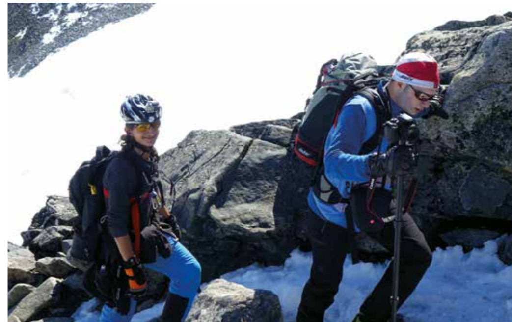
DET STORE MÅLET: Galdhøpiggen er litt vanskeleg å gå opp, men det er verdt det.

«Dei aktivitetane Røde Kors har tilbydd oss, er veldig positive for integreringa.»