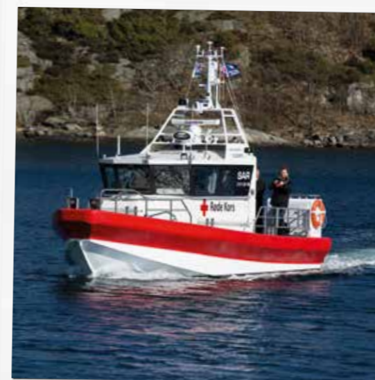
BEREDSKAPSBÅT: Kongen ble bragt til Haraldsvigen i den nye beredskapsbåten til Lillesand Røde Kors.

Tekst: Marianne Wellén