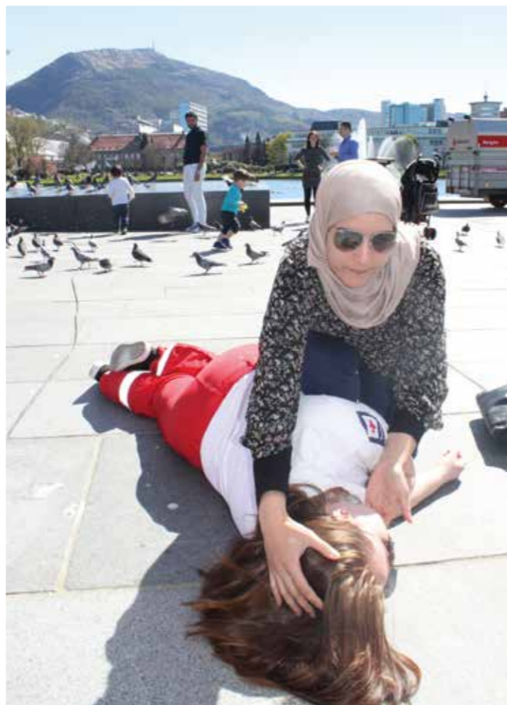
RINGLØYPE: En forbi-passerende får opplæring i livreddende førstehjelp, da Bergen Røde Kors markerte Røde Kors-dagen på Festplassen i Bergen.